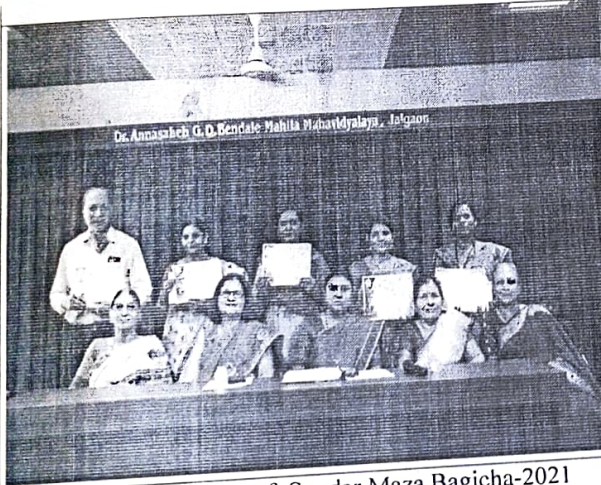
Winners and Examiners of Sundar Maza Bagicha-2021