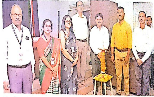
बेंडाळे महाविद्यालयातील कार्यशाळेत सहभागी प्राध्यापक व मान्यवर.