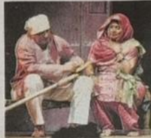
बेंडाळे महिला महाविद्यालयाने सादर केलेल्या ‘रतन’ नाटकातील एक क्षण.